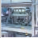
TecnoPilote IP 55 in PVC