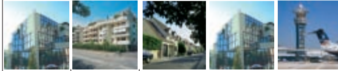
Pilote IP55 entrate stagne